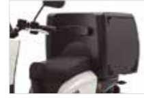
Caja de 350 L