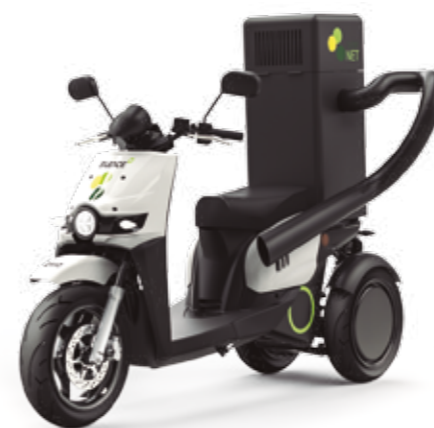
Servicio de limpieza