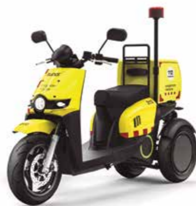
Servicio emergencias médicas