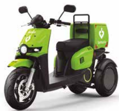
Servicio a Farmacias

El modelo S03 también disponible en otras versiones: